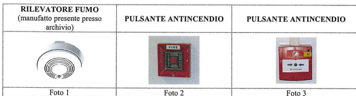
Foto 3: premendo con una semplice pressione del dito sul tondo nero indicato dalle due frecce vengono attivate le sirene di allarme antincendio e le misure di sfollamento dell'edificio.

Foto 2: rompendo il vetrino vengono attivate le sirene di allarme antincendio e le misure di sfollamento dell'edificio.